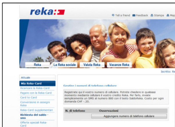
Registrazione nel RekaNet e

Basta registrare il suo numero di cellulare alla Reka nel RekaNet alla voce "Richiesta saldo SMS" e per il conto PostFinance al Postomat nell'E-Finance alla voce "Servizio" / "PostFinance Mobile".